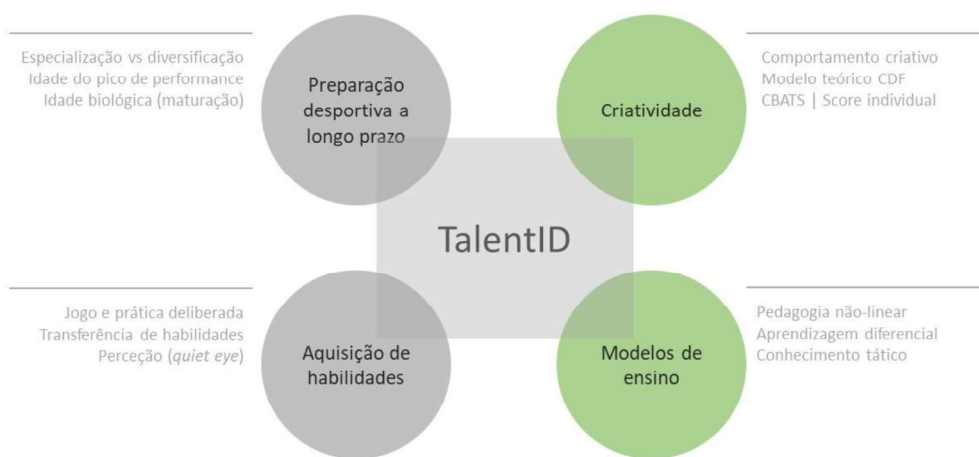
Figura 1. Representação das sub-áreas de investigação.

Esta lição centra-se no estudo de alguns factores que influenciam o processo de identificação e desenvolvimento do talento no desporto (TalentID). O domínio de investigação está dividido em diferentes sub-áreas que podem ser representadas da forma que a seguir se apresenta (Figura 1).