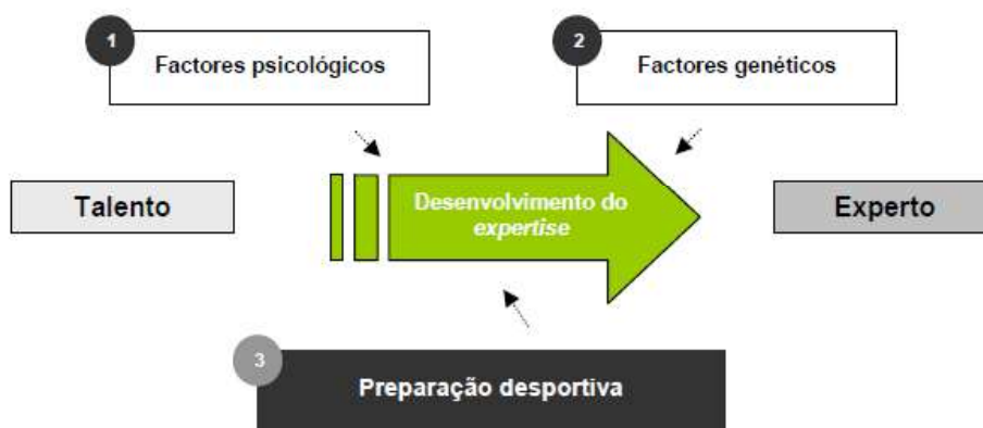
Figura 2. Factores de influência primária no desenvolvimento do expertise desportivo.

categorizados em (1) factores psicológicos, (2) factores genéticos, e (3) os factores relacionados com a preparação desportiva. De seguida, apresenta-se uma representação dos factores primários que influenciam o desenvolvimento de expertise no desporto.